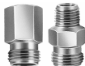
连接本体 (内螺纹或外螺纹)